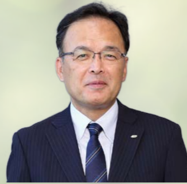
(株)ジーエス・ユアサ コーポレーション 代表取締役 取締役副社長 (株)GSユアサ 代表取締役 取締役副社長

サステナビリティ関連法令やESG課題、顧客ニーズなどが大きく変化する環境において、適切かつスピード感を持ってサステナビリティ課題へ対応することにより、当社の非財務価値ならびに企業価値を向上させ、ステークホルダーのみなさまのご期待に応えてまいります。